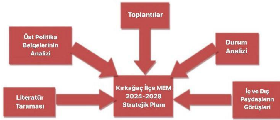
Şekil 1:Stratejik Plan Hazırlık Süreci

5018 sayılı Kamu Mal Yönetimi ve Kontrol Kanunu doğrultusunda, katılımcı bir anlayışla hazırlanan Manisa İl Millî Eğitim Müdürlüğü 2010-2014, 2015-2019 ve 2019-2023 Stratejik Planları uygulanmış ve 2019-2023 Stratejik Planı uygulama süreci devam etmektedir. Stratejik plan hazırlık çalışmalarının başladığı, Bakanlığımız tarafından 2022/21 sayılı Genelge ile duyurulmuştur. Genelgede bugüne kadar stratejik yönetim felsefesinin benimsenmesi ve kabiliyetinin geliştirilmesi konusunda gerçekleştirilenler özetlenmiştir. Taşra teşkilatı ile okul ve kurumların 2024-2028 stratejik planlarının hazırlanmasında izlenecek süreç, çalışma usul ve esasları ile hazırlık takvimi ekte gönderilen Millî Eğitim Bakanlığı 2024-2028 Stratejik Plan Hazırlık Programı ile belirlenmiştir. Stratejik plan hazırlık sürecinin illerdeki koordinasyon görevinin il millî eğitim müdürlükleri AR-GE birimlerince sağlanacağı belirtilmiştir. Taşra teşkilatında stratejik plan hazırlık sürecinde oluşturulacak ekip ve kurulların görevleri, çalışma usul ve esasları ile ilgili hususlara Hazırlık Programında yer verilmiştir.