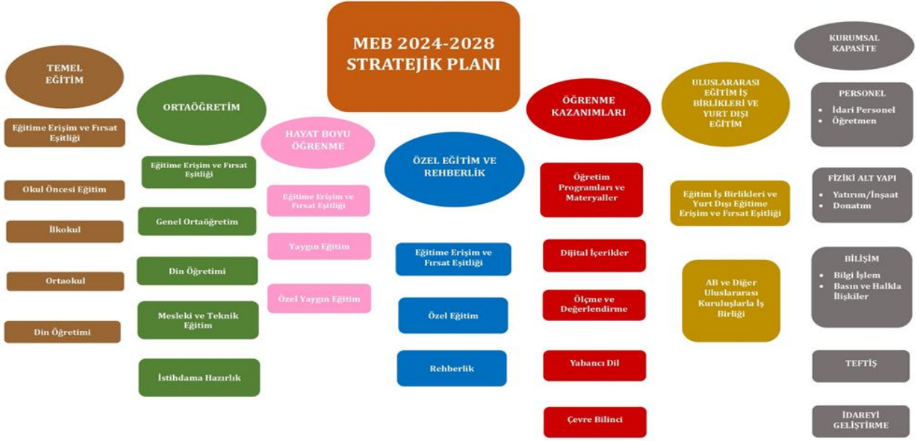
Şekil 2: Millî Eğitim Bakanlığı 2024-2028 Stratejik Plan Diyagramı

Hedef 6.5: Etkili bir izleme ve değerlendirme süreciyle beraber alınan kararları rasyonel hâle getirmek; birimler arası iletişimi güçlendirmek ve iş birliğini teşvik etmek için uygun iletişim kanalları ve araçları kullanılacak, teknolojik altyapı yatırımlarıyla kurumsal kapasite daha verimli hâle getirilecektir.